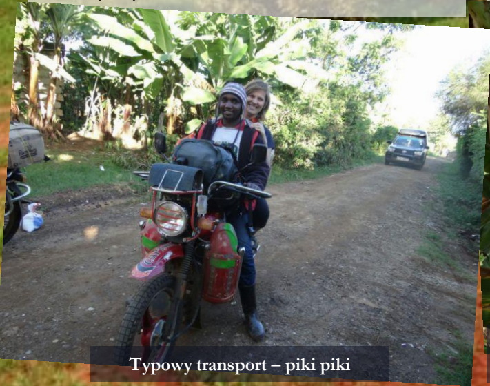
Typowy transport – piki piki

Kiamuri. Miejscowość w okolicach Mitunguu, mieszka tam trzech oazowych chłopców. Jest duża bieda, ale działa tam dobry kapłan, który ma świetne podejście do dzieci i młodzieży. Zapamiętałam jak powiedział, że dzieci to Kościół jutra . Wiedzą, że trzeba się zatroszczyć o młodzież, ale czasem nie wiedzą jak, dlatego jestem przekonana, że oaza ma coś do zrobienia