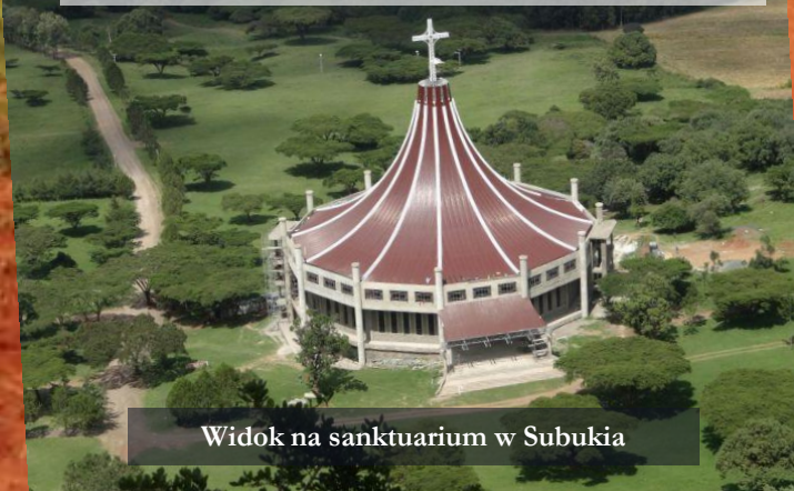
Widok na sanktuarium w Subukia