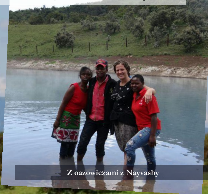
Z oazowiczami z Nayvashy